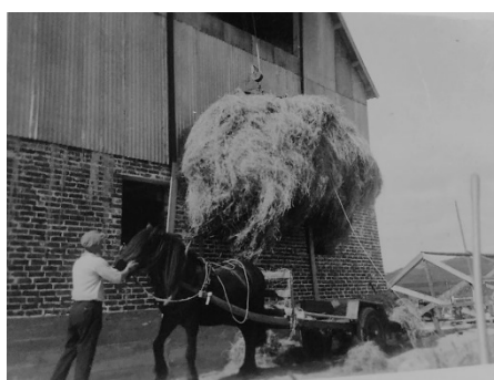
Høykjøring hos Rasman Tengesdal.