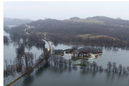
Siste garden på Tengesdal mot Egersund.