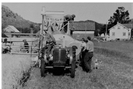
Julius Tengesdal med den nye skurtreskeren som han kjøpte og var den første i Bjerkreim 1950/52.