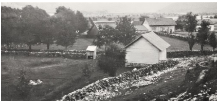
Nordre Tengesdal med det gamle skolehuset i forgrunnen, Foto: Peter A. Flak.