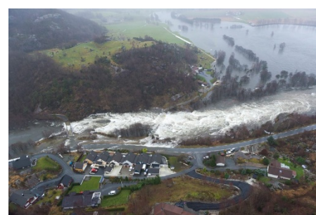
I Kleivane.